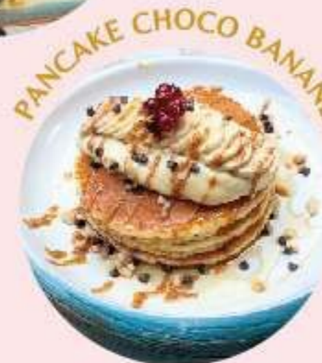
PANCAKE CHOCO BANANE