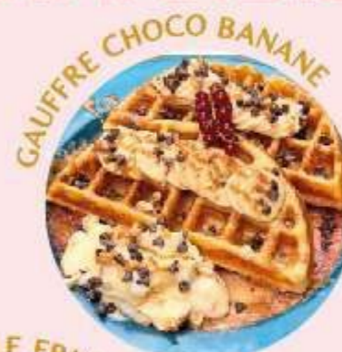
GAUFFRE CHOCO BANANE