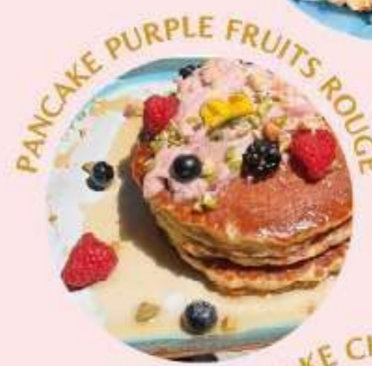
PANCAKE PURPLE FRUITS ROUGE